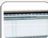
Lampe LED interne